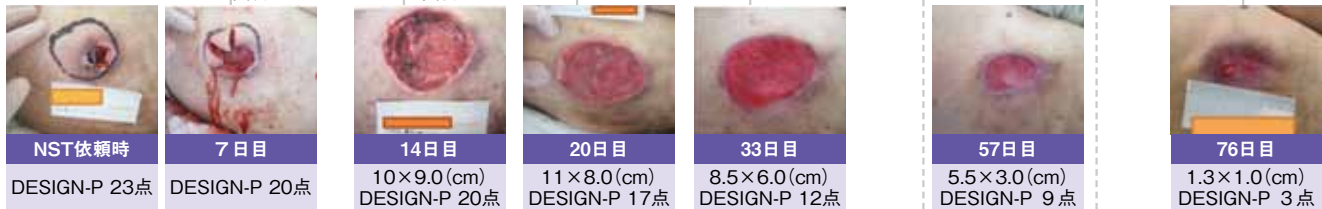
図4 栄養状態と腎機能、褥瘡の変化