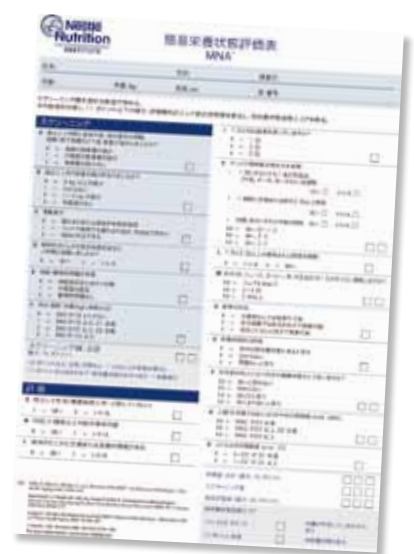
図5 簡易栄養状態評価表：MNA

◆ 講演の最後に田村氏は、静脈栄養と経腸栄養で栄養管理を行っている2人の患者の皮膚の状態を比較した写真を示し、「静脈栄養の患者さんの皮膚は少し触れただけで傷つきそうな脆弱さがありますが、経腸栄養の患者さんは肌がつやつやしています。ベッドサイドで患者さんの全身状態を観察していると、経口摂取、経腸栄養が生理的であることを改めて感じます。少しでも口から食べていただくことが大切であり、経腸栄養による栄養管理の有用性をもっと訴えていくことが重要だと思います」と結んだ。