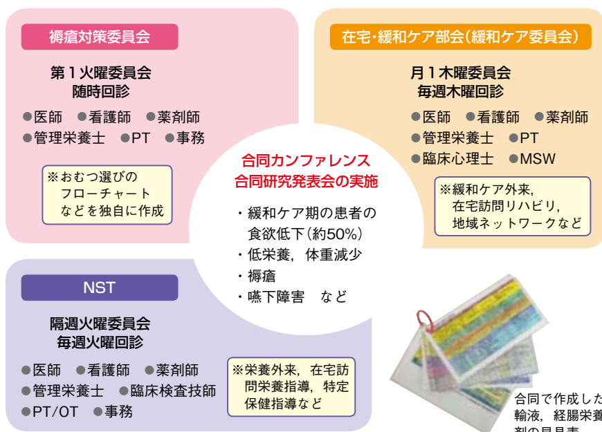
図1 福島労災病院のチーム医療体制

「1人の患者さんに対し、緩和ケア委員会とNSTがかかわるケースが多く、その患者さんに褥瘡ができた場合は褥瘡対策委員会も加わります。3つの委員会で自発的に話し合い、院内で採用している輸液や経腸栄養剤の早見表なども作成しました」(図1)