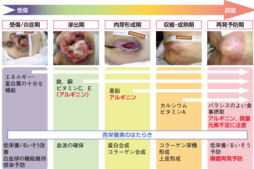
図2 創傷治癒過程と必要な栄養素の働き